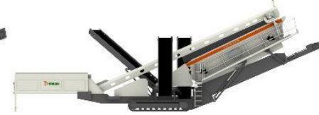
ST3.8-ST4.10 二次/三次移動式スクリーン

備考)上記最大能力は、見掛比重1.6の乾いた適正粒度の砂岩又は安山岩等を連続定量供給した場合を示したものです。 尚、破碎能力は供給原料の性状(硬さ、粒度、水分、泥分等)により変動します。