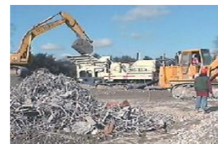
コンガラ&アスコンリサイクル

●本カタログに記載しています仕様、外観等は、予告なく変更することがありますのでご了承ください。