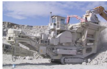
土木・建築用骨材生産

土木・建築用骨材生産はもとよりリサイクル、ダム用骨材、スラグ破碎等あらゆる用途に適応できます。