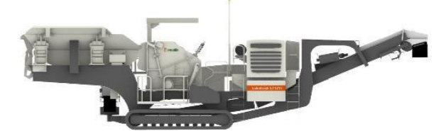
NPインパクトクラッシャ搭載ロコトラック