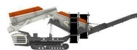
ST2.3-ST2.8 一次移動式スクリーン