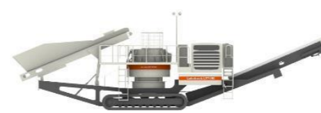
パーマック搭載ロコトラック