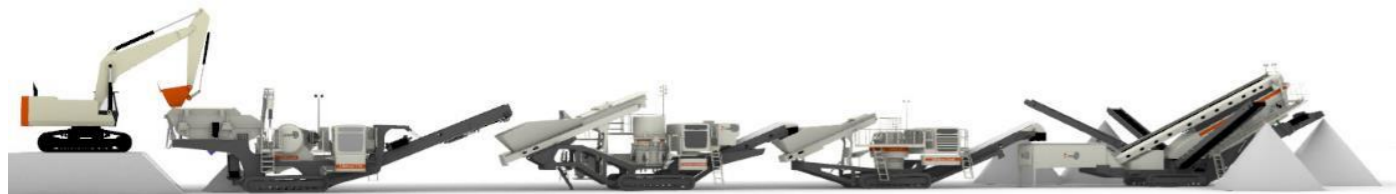
1次+2次+3次+スクリーンロコトラック破碎システム