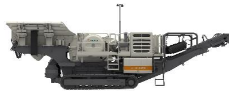
Cジョークラッシャ搭載ロコトラック