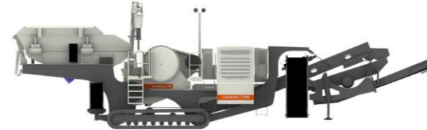
Cジョークラッシャ搭載ロコトラック-Sモデル