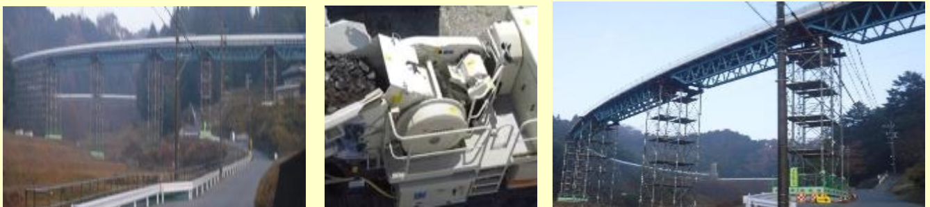
図6 A社納入、稼働中の電動破碎機、フリーラインコンベヤ写真