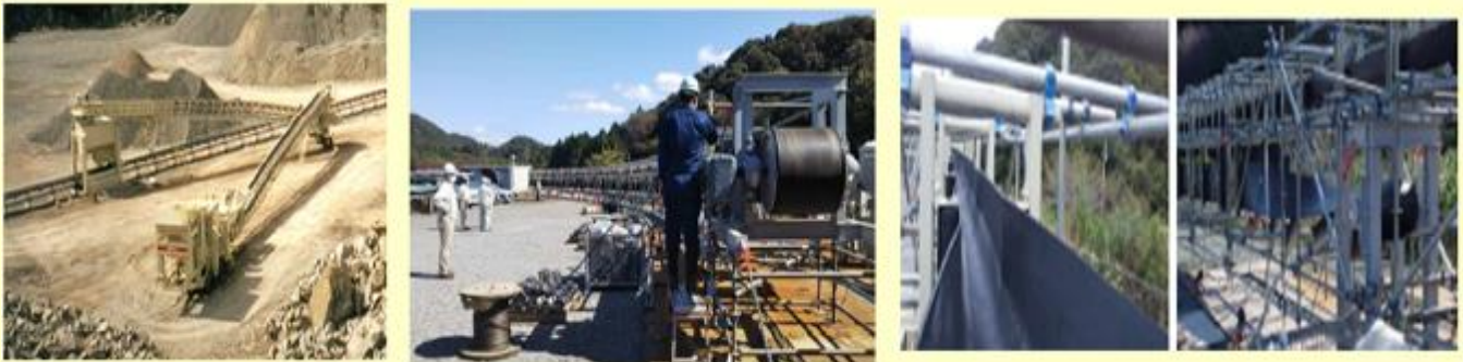
図5 電動式破碎機、フリーラインコンベヤ写真