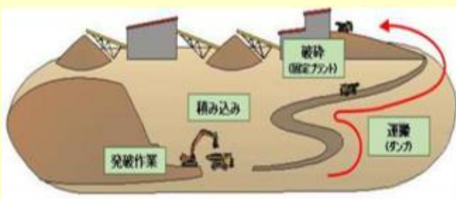
図3 従来工法 (ダンプ+固定式破碎機)