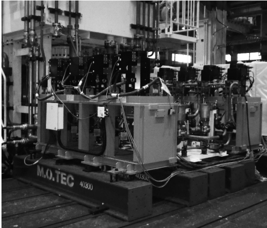
写真1 次世代機の本機ポンプ構成