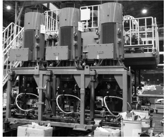
写真2 従来機の本機ポンプ構成

が小さいものを選定し、メインポンプ台数を増やしている。また押出速度について次世代機は従来機に比べ遅くなっているが、これはユーザーの実用速度を考慮して仕様を決定した。