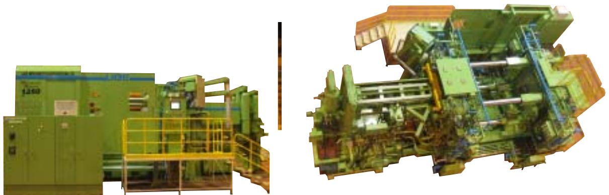
写真1 UH1250 ダイカストマシン

金型の取付け・取外しにおいて、ダイカスト金型は中子シリンダが大きく、タイバーを抜かないと金型が取付けられないケースが多い。